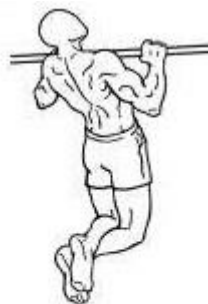
Figura 3 – Posição 02 intermediária.