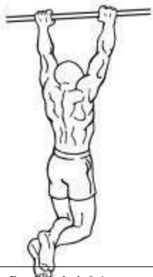
Figura 2 – Posição inicial 01 e, posição final 03.

b.2 Número de repetições: conforme tabela "Anexo IV".